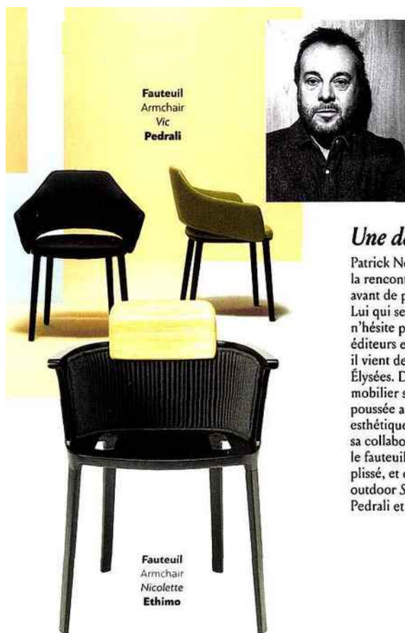
Fauteuil Armchair Vic Pedrali