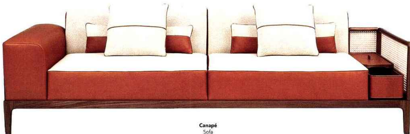
Canapé Sofa Sellier Hermès