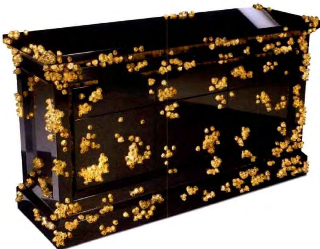
Commode Lost at Sea © Jake Phipps

Le designer : Jake Phipps est un designer britannique qui a collaboré notamment avec Poltrona Frau. Il est surtout connu pour apporter une pointe d'humour "so british" dans la plupart de ses créations, qu'il s'agisse de luminaires chapeau melon façon Alice au Pays des merveilles ou, plus récemment, de tabourets en forme de douilles, reproduites avec pléthore de détails.