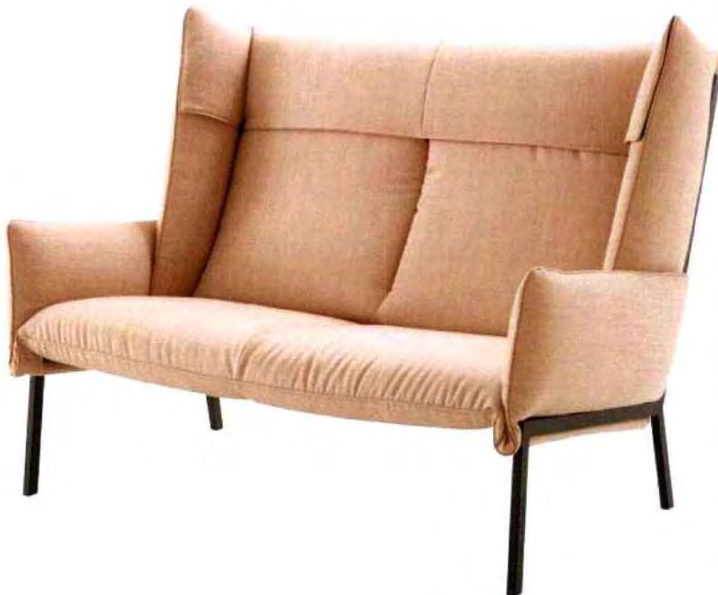
Canapé Beau Fixe

La designer : Inga Sempé fait maintenant partie de la famille Ligne Roset. Après avoir signé le célèbre canapé Ruché, inspiré comme son nom l'indique de la structure d'un nid d'abeilles, la designer française revient cette année avec une autre proposition : Beau Fixe.