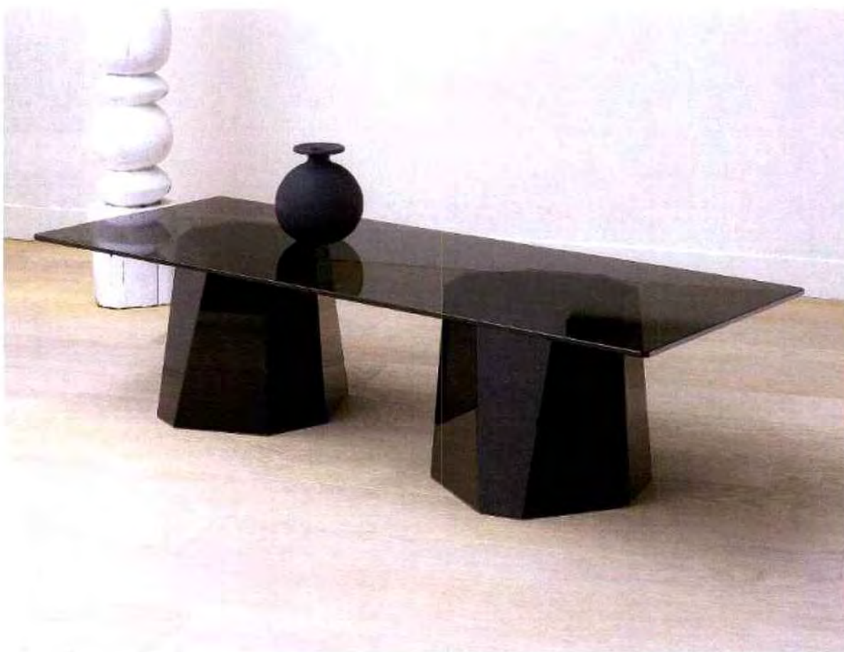
Table basse Cristall