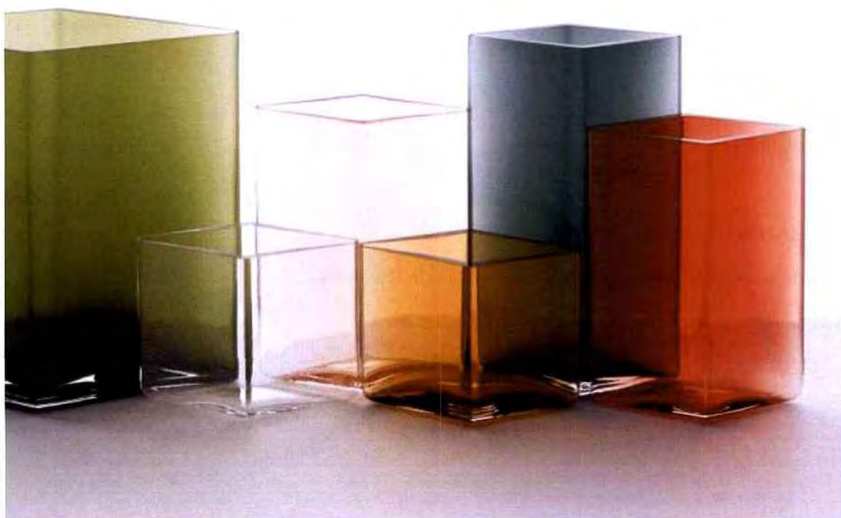
Vases Ruutu © Iittala

Les designers : Ronan et Erwan Bouroullec sont les premiers designers français à collaborer avec Iittala. Les deux frères sont connus pour leurs pièces organiques et leurs nombreuses collaborations, notamment avec Alessi, Cappellini et Vitra.