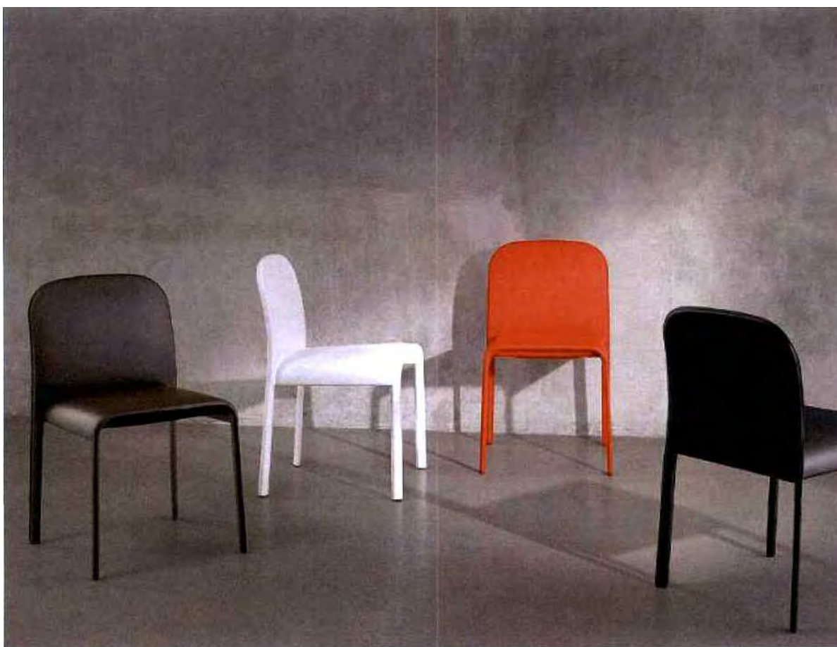
Chaise Scala © CoEdition

Ce que les grandes stars du design nous réservent pour 2015