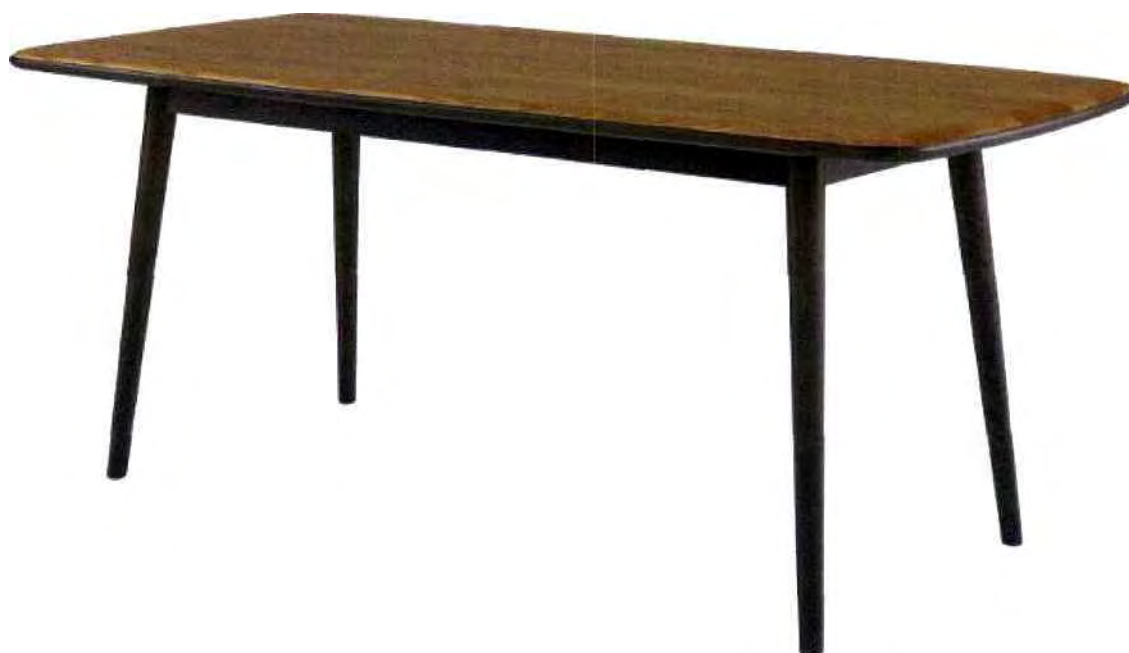
Table Lady Carlotta